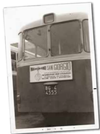
Sopra: una delle prime pubblicità della Investigazioni San Giorgio, nel 1969.

Conoscere per decidere: acquisizione di prove documentali a tutela di un diritto violato, attività mirate alla sicurezza della propria impresa o dei propri cari, contributi efficaci per scelte strategiche supportati da fatti ed elementi concreti acquisiti con discrezione, riservatezza e massima serietà. Disporre di informazioni certe rappresenta il primo vero affare per la vita aziendale.